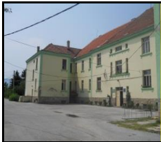
Сл 1. Училишна зграда

Во дворното место на Училиштето се наоѓаат и помошни објекти и тоа: комплекс на објекти – штали, силоси, амбар, ботаничка - овошна градина со вграден систем за наводнување капка по капка, цвеќара, оранжерија.