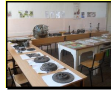
сл 3. Кабинет по мотори и трактори

Училниците се опремени со компјутери од проектот на Владата на Р. Македонија „Компјутер за секое дете“ и обезбеден е пристап до интернет за целите на наставата. Истите располагаат со технологија за изведување на современа настава според нормите и барањата на денешниот образовен систем. Старите компјутери се распределени за администрацијата и за работа и обука на персоналот. Опремена е и помошна просторија за кариерен центар во рамките на училиштето.