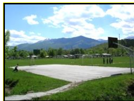
Сл.3 Спортски терени