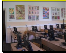
сл2. Кабинет по цвеќарство