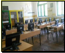
сл1. Кабинет по биологија

Воспитно-образовната дејност во училиштето се одвива во една училишна зграда со 15 училници, кабинети по биологија, цвеќарство, мотори и трактори и информатика кои се опремени со современи нагледни аудио визуелни дидактички средства, при што веќе можат да се приметат резултатите од нивната примена во наставата.