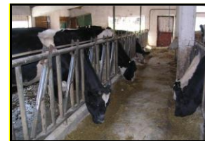
Сл. 4 Училишна фарма

Училиштето располага и со земјоделско земјиште од 24 хектари во непосредна близина на училишната зграда, кои се обработени под различни култури и на кои се изведува практична настава.