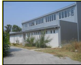
Сл. 2. Спортска сала