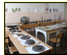
сл 3. Кабинет по мотори и трактори

Училниците се опремени со компјутери од проектот на Владата на Р. Македонија „Компјутер за секое дете“ и обезбеден е пристап до интернет за целите на наставата. Истите располагаат со технологија за изведување на современа настава според нормите и барањата на денешниот образовен систем. Старите компјутери се распределени за администрацијата и за работа и обука на персоналот. Опремена е и помошна просторија за кариерен центар во рамките на училиштето.