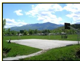
Сл. 3. Спортски терени