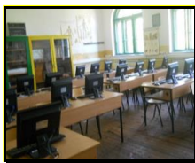
сл1. Кабинет по биологија

Воспитно-образовната дејност во училиштето се одвива во една училишна зграда со 15 училници, кабинети по биологија, цвеќарство, мотори и трактори и информатика кои се опремени со современи нагледни аудио визуелни дидактички средства, при што веќе можат да се приметат резултатите од нивната примена во наставата.