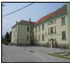
Сл. 1. Училишна зграда

Во дворното место на Училиштето се наоѓаат и помошни објекти и тоа: комплекс на објекти – штали, силоси, амбар, ботаничка - овошна градина со вграден систем за наводнување капка по капка, цвеќара, оранжерија.