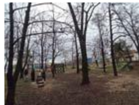
Сл. 7 Парк за социјализација на миленици

Училиштето располага и со земјоделско земјиште од 24 хектари во непосредна близина на училишната зграда, кои се обработени под различни култури и на кои се изведува практична настава.