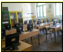
сл1. Кабинет по биологија

Воспитно-образовната дејност во училиштето се одвива во една училишна зграда со 15 училници, кабинети по биологија, цвеќарство, мотори и трактори и информатика кои се опремени со современи нагледни аудио визуелни дидактички средства, при што веќе можат да се приметат резултатите од нивната примена во наставата.