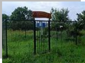
Сл. 5 Метео станица