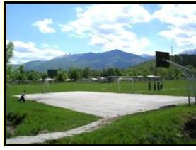
Сл. 2 Спортски терени