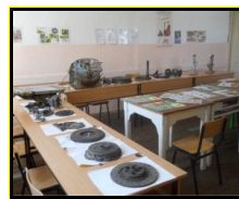
сл 3. Кабинет по мотори и трактори