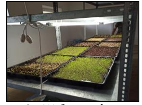
Сл. 4 Урбана градина