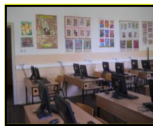
сл2. Кабинет по цвеќарство