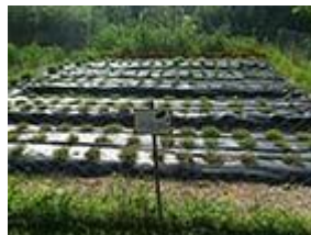
Сл. 6 Еко-градина