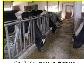
Сл. 3 Училишна фарма