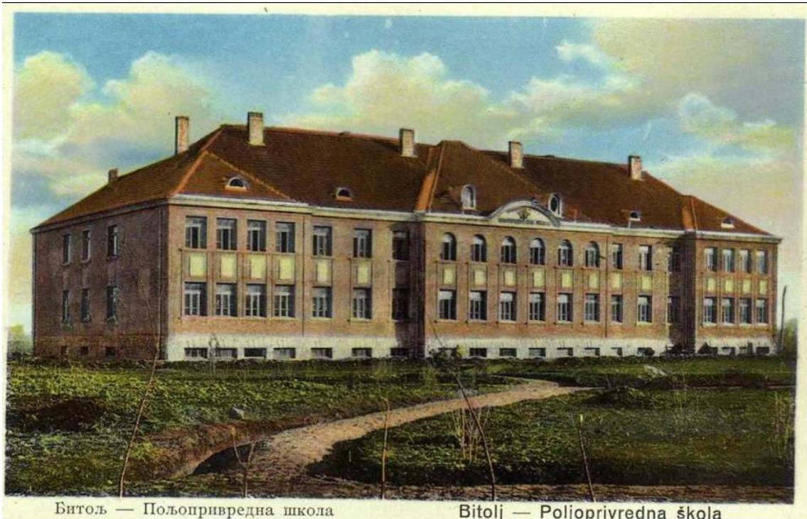
Битољ — Пољопривредна школа

на училиштето СОЗУ „Кузман Шапкарев“ - Битола за учебната 2023/2024 година