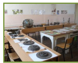
Сл. 4 Кабинет мотори и трактори