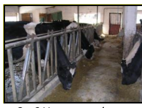
Сл. 3 Училишна фарма