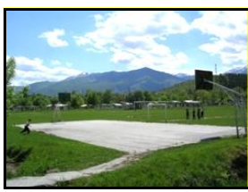
Сл. 2 Спортски терени