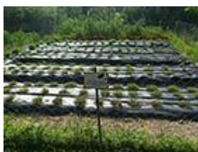
Сл. 6 Еко-градина