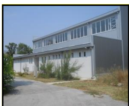
Сл 1. Спортска сала

Училниците се опремени со нови компјутери и е обезбеден е пристап до интернет за целите на наставата. Истите располагаат со технологија за изведување на современа настава според нормите и барањата на денешниот образовен систем. Старите компјутери се распределени за администрацијата и за работа и за обука на персоналот. Опремена е и помошна просторија за кариерен центар во рамките на училиштето.