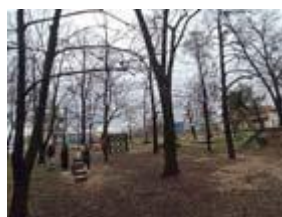
Сл. 7 Парк за социјализација на миленици