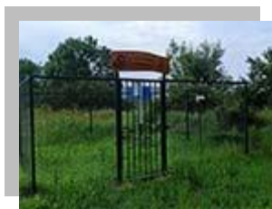
Сл. 5 Метео станица