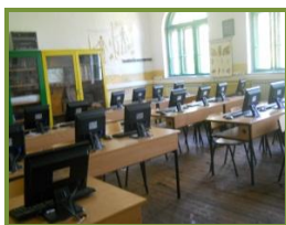
Сл9. Кабинет по биологија